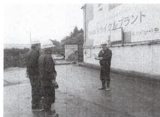
訓練の目的及び役割を説明