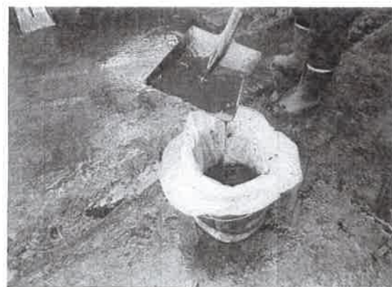
スコップで多量の油を取り除く