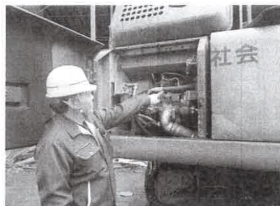
重機からの油漏れを確認